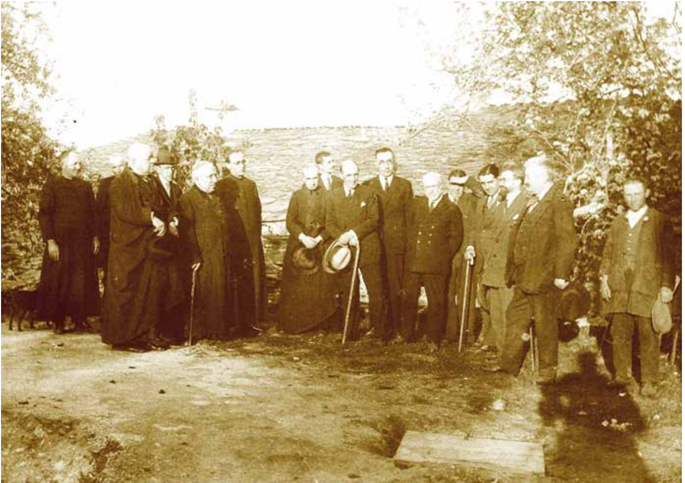
Figura 5a. Visita institucional a Santa Eulalia de Bóveda (Archivo privado de Juan Ramón Suárez Núñez).