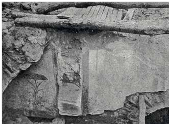
Figura 3. Pinturas del lienzo interior de la puerta de acceso (López-Martí, 1927a).

Tras la lectura de este texto se comprende mejor la inquietud y la preocupación mostrada por Luis López-Martí y por Manuel Vázquez Seijas. De hecho, los daños que afectaron a la integridad de los restos arqueológicos se hacen patentes en la desaparición de un significativo fragmento de enlucido con decoración pictórica. Esto se puede comprobar comparando la imagen publicada en enero de 1927 en la Revista Gallega (Figura 3) 23 con la fotografía de la excursión (Figura 1). En ellas se aprecia la presencia y ausencia respectivamente de un gran fragmento de pintura mural. Teniendo en cuenta su disposición en un área especialmente expuesta a las inclemencias del tiempo puede explicar, que no justificar, la causa de la fatal pérdida. Tampoco existe constancia de que los trozos fueran rescatados para proceder a garantizar su preservación en otro lugar.