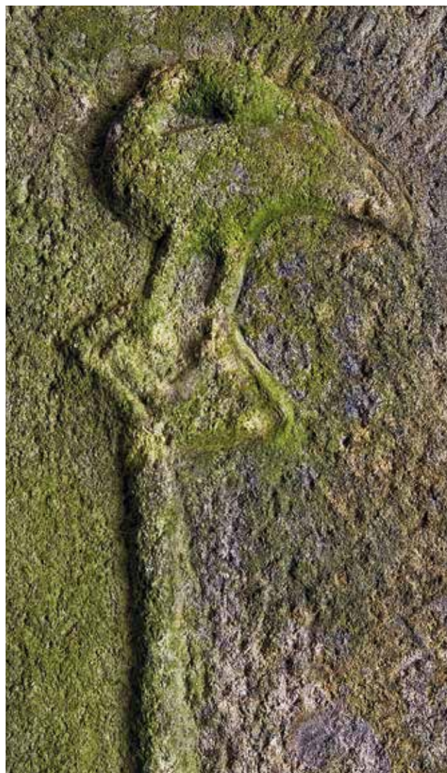
Figura 4. Bajorrelieve de un ave sobre árbol o pedestal.