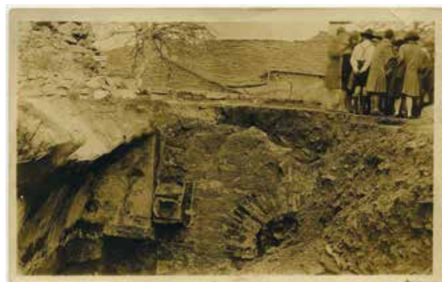
Figura 1. Excursión de visita a Santa Eulalia de Bóveda, primavera de 1927.

La prensa local se hizo eco de la expectación generada 7 y las visitas de investigadores, turistas y curiosos se sucedieron a buen ritmo. La fotografía de una excursión a Santa Eulalia de Bóveda de un grupo de mujeres acompañadas por un personaje masculino, aparentemente vestido a la manera tradicional bávara con su típico Lederhose, ilustra adecuadamente estos hechos, tanto en el espacio como en el tiempo. Teniendo en cuenta la fase en la que se encuentra el proceso de excavación del monumento, se puede situar cronológicamente esta instantánea entre finales de invierno e inicio de la primavera de 1927 (Figura 1).