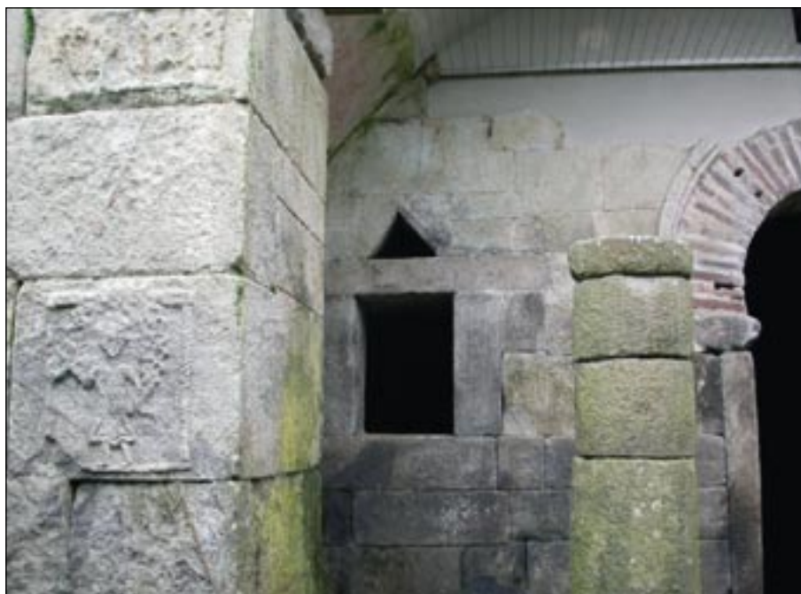
Ilustración 1: Detalle del vestíbulo de Santa Eulalia de Bóveda. La ventana de la izquierda era el único vano de acceso mientras no comenzaron los trabajos de desescombro.

Descrito inicialmente como bóveda subterránea, sólo se podía acceder a una angosta área de su inte-