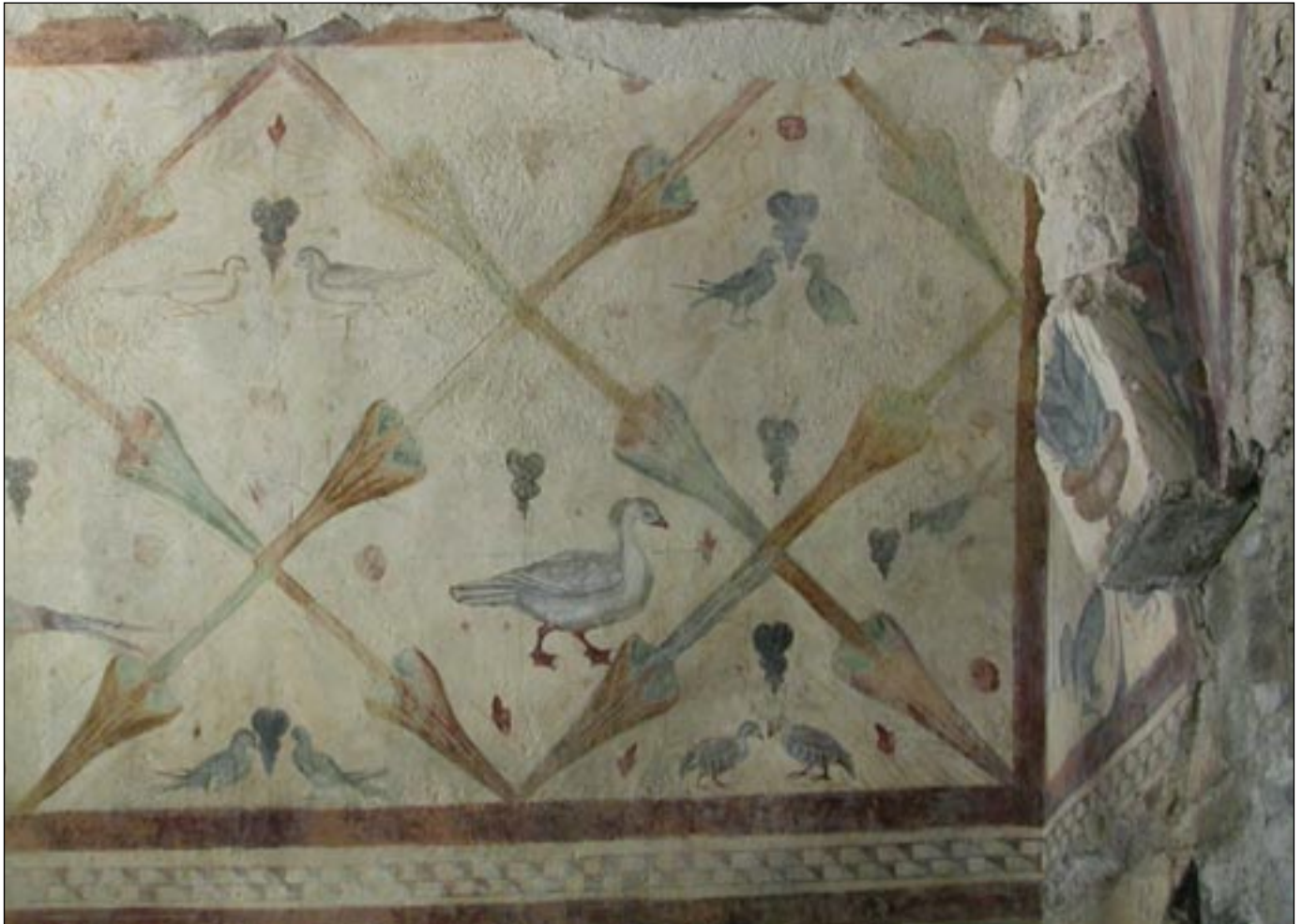
Ilustración 2: Algunos motivos de las pinturas que dan fama a Santa Eulalia de Bóveda. Fondo de la nave lateral sur.

el estudio de la cultura hispanorromana. Sus peculiaridades arquitectónicas y decorativas conllevaron a que desde un principio se planteasen varias opiniones sobre su cronología y funcionalidad.